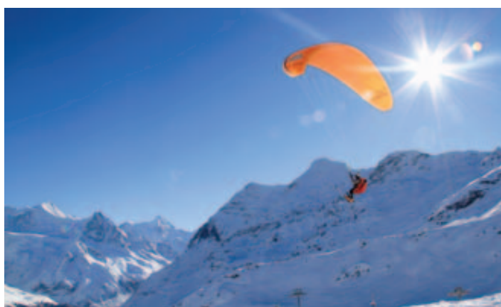
Des épreuves sportives dans un cadre magnifique.